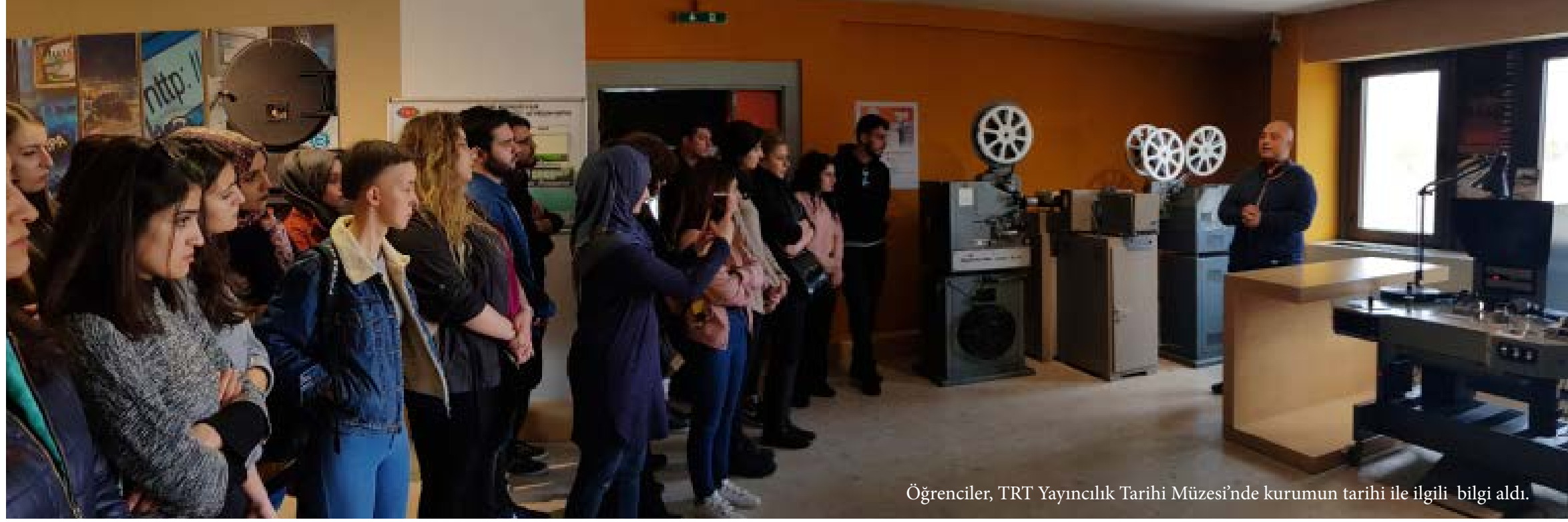
Öğrenciler, TRT Yayıncılık Tarihi Müzesi'nde kurumun tarihi ile ilgili bilgi aldı.